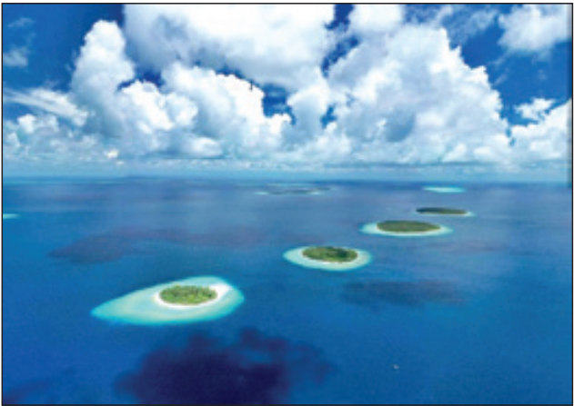
جزایر شناور در مالدیو