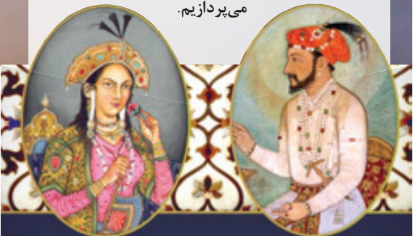
تیمور و همسرش شاه جهان و همسرش

«تاج محل» از پرآوازه ترین بناهای جهان در نزدیکی شهر آگرا و در ۲۰۰ کیلومتری جنوب دهلی نو پایتخت هند واقع شده است. این بنا به دستور شاه جهان، پنجمین امپراتور گورکانی هند برای یادبود همسر ایرانی تبارش «ارجمند بانو بیگم» مشهور به «ممتاز محل» که در سال ۱۶۳۱ میلادی در سفری به هنگام وضع حمل فوت کرد، بنا شده است. مدارک نشان می دهد که سوگ شاه جهان پس از مرگ همسرش، نوعی روایت عاشقانه و انگیزه ساخت تاج محل است. این ساختمان بر پایه ترکیبی از معماری مغولی، ایرانی، هندی و اسلامی بنا شده است. در وصف شکوه این مجموعه مر مرین می توان کتاب ها نوشت، فیلم ها ساخت و باز هم حرف تازه ای برای گفتن داشت. ناگفته نماند که معماری تاج محل به سبب دقت بالا، تقارن بی نظیر و به خصوص وجود مرمر سبید، به قدری چشمگیر است که باعث شده است این مقبره باشکوه در سال ۱۹۸۳ در فهرست میراث جهانی یونسکو با عنوان «جواهر هنر اسلامی در هند و یکی از شاهکارهای تحسین شده میراث جهانی» به ثبت برسد و در نظر سنجی بزرگ جهانی در سال ۲۰۰۷ میلادی در شمار یکی از عجایب هفتگانه جهان در دوران حاضر شناخته شود. سالانه میلیون ها گردشگر به امید نگاهی هر چند سطحی به این زیباترین بنای جهان، عازم آگرا می شوند، محلی که در سال ۲۰۱۶ در فهرست برترین جاذبه های گردشگری آسیا قرار گرفت. امروز یعنی ۳۰ دی، سالروز پایان ساخت عمارت تاج محل توسط معماران و خوش نویسی های ایرانی است و به بهانه گرامی داشت ساخت این بنا توسط هنرمندان ایرانی، به نکاتی جالب درباره دلایل برتری معماری این بنا و قرار گرفتن اش جزو عجایب هفتگانه جهان، داستان های تایید نشده و برخی دانستی های عددی جالب درباره تاج محل می پردازیم.