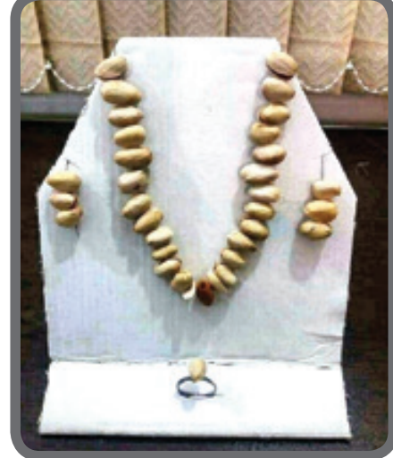
نیم ست آجیل طلا، مناسب خرید در شب یلدا!!

ریشه ضرب‌المثل | مغز خر خور دن زنی به قصد آن که شوهرش را احق کند به یاری پیرزنی رمال، کله خری به دست آورد و در حیاط خانه مشغول بیرون آوردن مغز خر بود تا به خورد شوهرش بدهد. شوهر از در وارد شد و آن صحنه را دید. زن گفت: «چیزی نیست، این کله خر در منقار کلاغی بود که از بالای حیاط می‌گذشت، اما کلاغ نتوانست وزن آن را تحمل کند و رهایش کرد و افتاد در این لگن.» مرد سری به علامت قبول تکان داد و به اتاق رفت. همسر مرد نگران جریان را برای پسرزن رمال تعریف کرد. پسرزن گفت: «دیگر به کله خر نیازی نیست، کسی که چنین سخنان بیهوده‌ای را باور کند به خوردن مغز خر نیازی ندارد!»