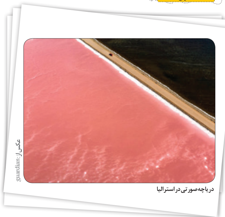
دریاچه صورتی در استرالیا

ترجمه: هوادر کوهستان می‌تواند خیلی سریع تغییر کند، پس لباس مناسب بردارید.