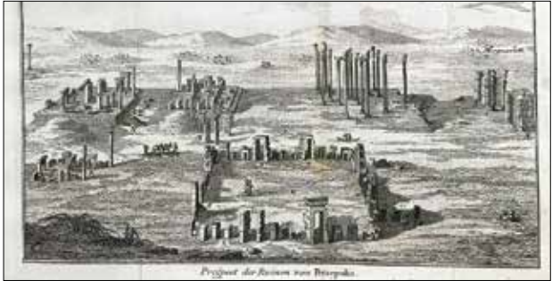
▲ تصویری از تخت جمشید در سفر نامه نیبور