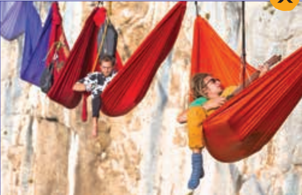
چالش ۱۹ ماجراجو در خوابیدن در ارتفاع ۲۰۰ متری دره «تیجسنو» در یوسنی و هرز گوین