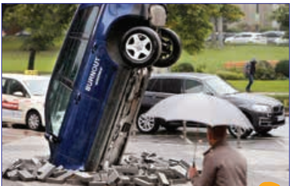
آلمان مفهومی نصب شده در مقابل نمایشگاه بین المللی خودروی آلمان در اعتراض به آلودگی های زیست محیطی خودروها