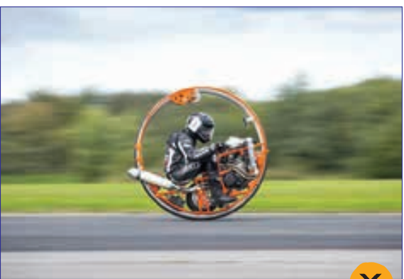
شرکت با یک خودروی تک چرخ در مسابقات سالانه سرعت در یورکشایر بریتانیا