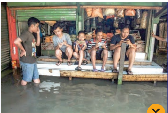
فرانس پرس- جوانان اندونزیایی در حال بازی وسط سیل گرفتگی کوچه های شهرشان!