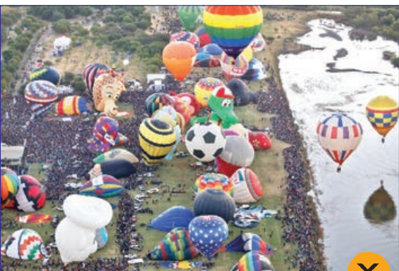
تلگراف- ده ها بالون در جشنواره بالون های مکزیک