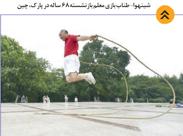
شینپوا- طناب بازی معلم بازنشسته ۶۸ ساله در پارک، چین