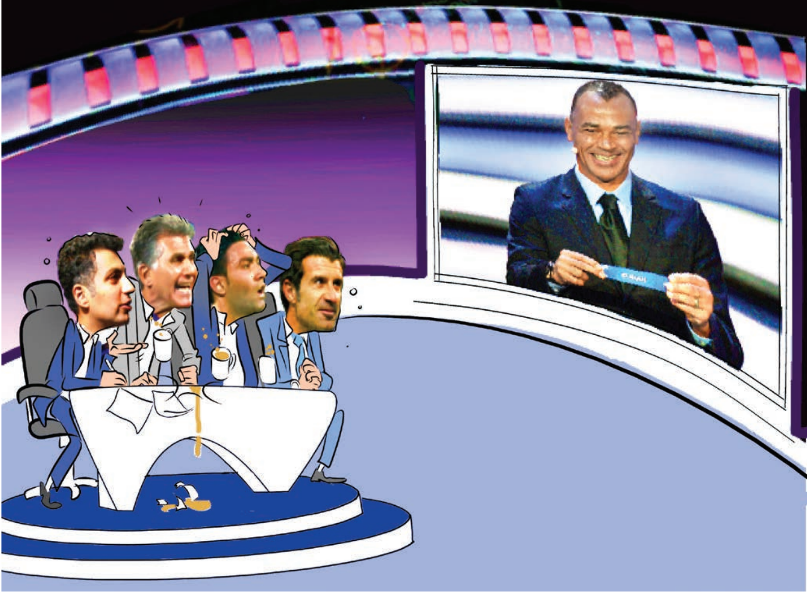
تصویر ساز: سعید مرادی