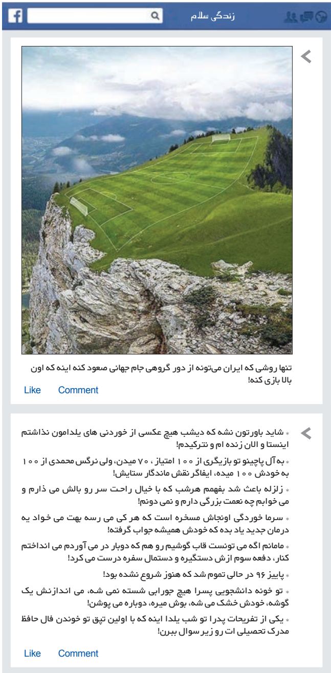
تنها روشی که ایران می‌تونه از دور گروهی جام جهانی مسعود کنه اینه که اون بالا بازی کنه!

❖ بدین وسیله از علیرضا کاردار به دلیل یادآوری فرهنگ سپاس‌گزاری تقدیر و تشکر می‌کنم! ❖ لطفاً پای آگهی‌ها را به صفحات زندگی سلام باز نکنید. ممنون. پاسخ خفن استریپ شماره قبل: نهال - ملال آور - خروجی