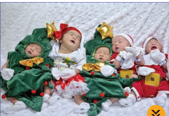
گاردین - نوزادانی که شب و روزهای کریسمس به دنیا آمده اند، بیمارستانی در تایلند