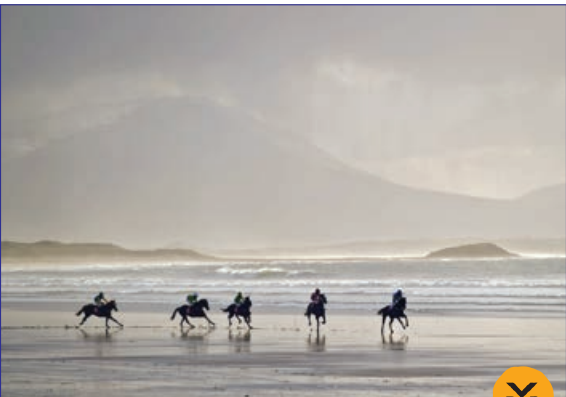
مسابقات اسب سواری ساحلی، ایرلند