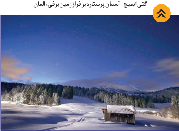
آسمان پرستاره بر فراز زمین برفی، آلمان