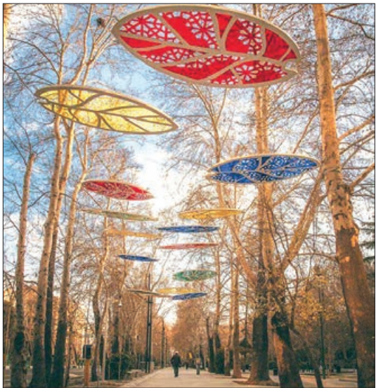
روشی برای زیباسازی شهر، پارک ملت تهران