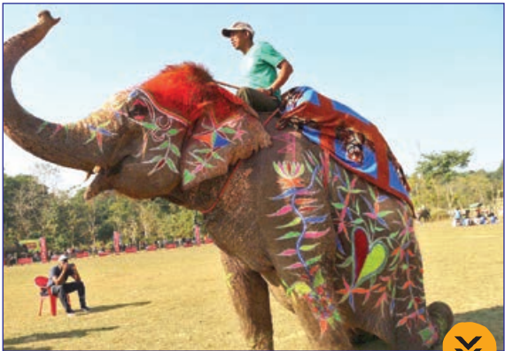
تلگراف- جشنواره فیل ها، نپال