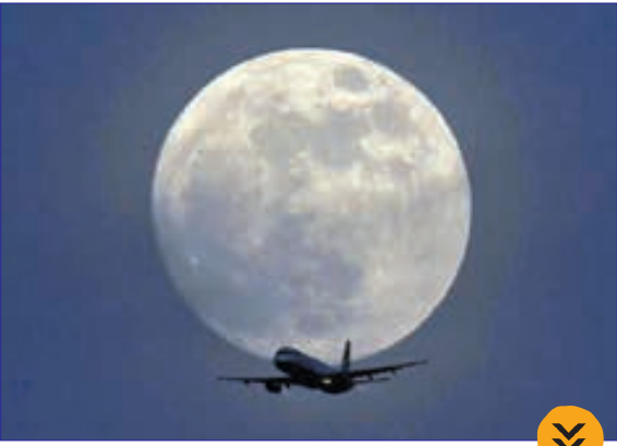
لحظه عبور هواپیماز مقابل ماه کامل، انگلستان