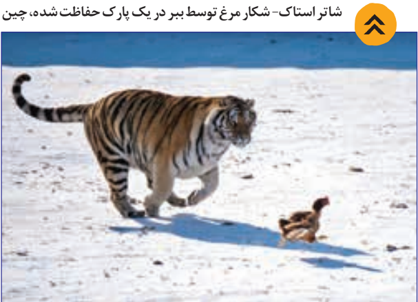
شکار مرغ توسط ببر در یک پارک حفاظت شده، چین