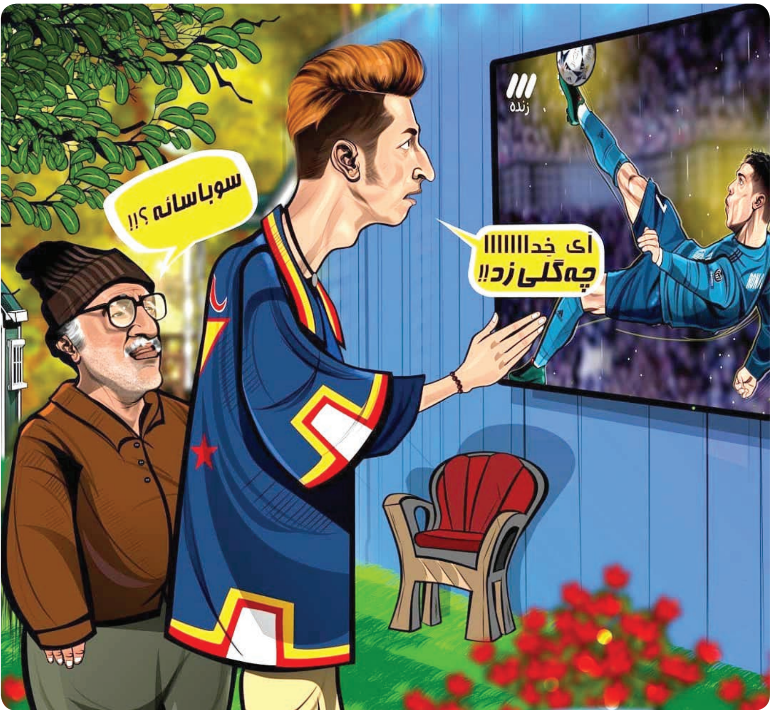
تصویر ساز: حمید سجادی

اگر از لباس پوشیدن و مدل موی «بهتاش» یا بتخت بگذریم، بی‌تردید تکیه کلام نقش بهتاش در پنجمین پایتخت سسپروس مقدم، حالا دیگر تکیه کلام بیشتر جوان‌های جامعه‌مان شده است. کافی است به آن‌ها یک جمله بگویید تا در پاسخ تان بگویند: «آی خدا!!!!!!»! اگر چه در همین نوزد، سریال‌های دیگری هم بود که با تکیه کلام‌های شخصیت‌های داستان مورد توجه قرار گرفتند، اما بی‌تردید نه «من از بچگی بین .... بزرگ شدم» و یسکا آسایش در «دیوار به دیوار ۲» و نه «عمه‌هه» گفتن‌های احسان کرمی در «هیئت مدیره» هیچ‌کدام نتوانستند آن چنان که باید و شاید کار کرد یک تکیه کلام واقعی را ایفا کنند و در جامعه فراگیر شوند. پرونده امروز زندگی سلام نگاهی دارد به همه تکیه کلام‌هایی که در دهه‌های اخیر، از دل سریال‌ها و شخصیت‌های تلویزیونی به خانه‌هایمان آمدند، در دل کوچه و بازار ورد زبان‌مان شدند و با خوب و بدشان بر ایمان خاطره ساختند.