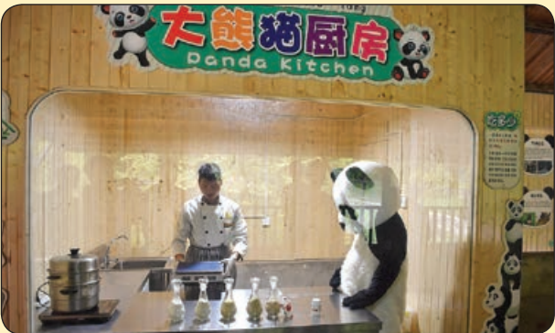
گتی ایمیج | آماده کردن غذای پانداها در پارکی مقابل بازدید کنندگان چین

تاکسل - برای بعضی ها ورزش کردن از نان شب هم واجب تر است. این افراد حتی وقتی در سفر و تفریح هستند دوست دارند ورزش کنند. «د شایک بایکس» نام شرکت دو چرخه سواری معروفی است که به تازگی جدیدترین محصولش را روانه بازار کرده است. این محصول ۴۵۰۰ یورو قیمت دارد و با آن به راحتی می شود بر روی آب و دریا هم دو چرخه سواری کرد و از مناظر لذت برد.