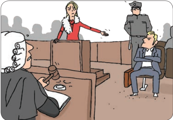
ترجمه و تصویرسازی: فرنگیس یاقوتی، سعید مرادی

در جلسه دادگاه، خانم موری که در جایگاه شاکی ایستاده بود خطاب به رئیس دادگاه گفت: «من واقعاً نمی خوام از شوهرم شکایت کنم... اما آقای قاضی باید شما بدوینید که من ایشون رو میلیون کردم!» قاضی با تعجب به خانم و آقا نگاه کرد و دوبر سید: «واقعاً؟ یعنی قبل از ازدواج با آقای موری، ایشون فقیر بود؟» خانم موری با افتخار گفت: «نخیر! امیلیار بود!»