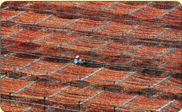
گاردین | کارگاه خشک کردن محصولات کشاورزی، ترکیه

دستگاهی که در عکس می بینید مخصوص کسانی است که در خانه از فرزند شیر خوارشان نگهداری می کنند. این دستگاه اختراع اینجانب بوده، با برق و باتری کار کرده و قابل نصب در هر مکانی با گارانتی و خدمات پس از فروش تا کلاس اول فرزند شماست. با ارائه گواهی بیکار بودن پدران و شاغل بودن همسران شان، از تخفیف ویژه پدران خانه دار برخوردار شوید.