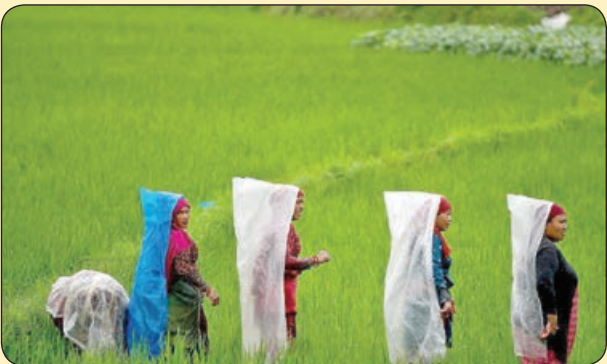
کشاورزان نیپالی زیر باران

در این شهر میان این مردمان رنگی به دنبال رنگ خود می گردم اما کمرنگ تر از همیشه ام بیم خاستری شدن میان دود این انسان ها در این آبرنگ زندگی سفید آمدن، سفید ماندن و سفید رفتن بسی دشوار