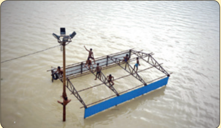
بازی بچه ها در خیابان های آب گرفته، هندوستان