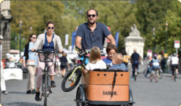
روز بدون خودرو، بروکسل