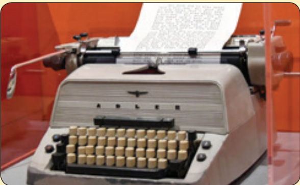
ماشین تحریر استنلی کوبریک که با آن توضیحات فیلم «درخشش» را نوشت در موزه فیلم سازان، انگلستان