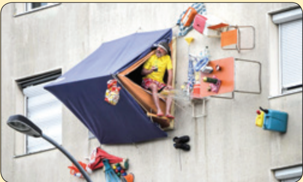
اجرای نمایش خیابانی یک هنرمند روی دیوار، فرانسه

و دوباره ستاره قلم شکفت و میوه احساس در گلوگاه نغمه ای حزین به بیرون خزید و دوباره آفتاب در زیر سایه درختان به تراوش دانه های بلور ادامه داد صبح دل انگیز طلوع در راه بود