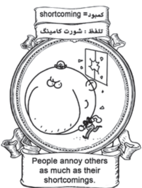
انسان ها به اندازه کمبودهای شان دیگران را آزار می دهند. (ژان پل سارتر)

لکه های قهوه چیه شده روی کاغذ، تصاویر جالبی را طراحی می کند. او از لکه های تیره اسپرسو، هیولا های بامزه ای درست می کند. ابتکاری که تاکنون به فکر هیچ شخص دیگری نرسیده بود.