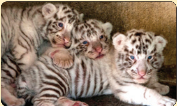
گتی |میچ| سه توله ببر سفید تازه به دنیا آمده در باغ وحش، مکزیک