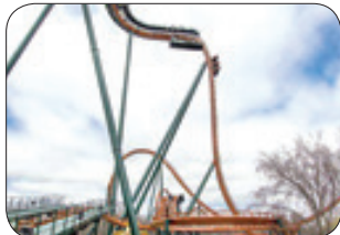
سی ان ان- بلندترین، طولانی ترین و سریع ترین ترن هوایی جهان در شهر بازی «اندرلند» در تورنتو کانادا با نام «یوکان استرایکر» افتتاح شد. با سوار شدن در این ترن هوایی باید آمادگی برای یک سقوط عمودی مستقیم بعد از معلق ماندن در هوا به مدت ۳ ثانیه در ارتفاع ۷۵ متری از سطح زمین و سپس داخل یک تونل زیر آبی شدن، غلتیدن در یک قوس قطر های شکل و چرخیدن در یک حلقه ۳۶۰ درجه ای را داشته باشید. این ترن هوایی با سرعت ۱۳۰ کیلومتر در ساعت حرکت و از بیش از ۱۱۰ متر ریل عبور می کند.