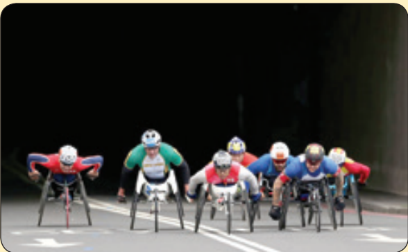
مسابقه ویلچررانی، لندن

کان جا هزار نافه مشکین به نیم جو تخم وفا و مهر در این کهنه کشته زار آن گه عیان شود که بود موسم درو