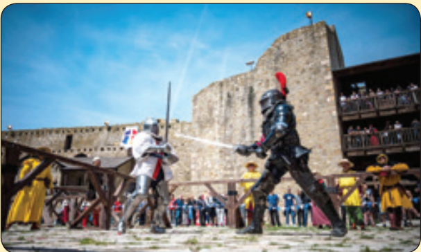
بازسازی جنگ باستانی بین شوالیه ها، صربستان