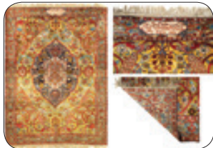
دوبیچه وله- یک فرش ایریشم قاچاری با قدمت ۲۳۰ سال که به فرمان فتحعلی شاه قاچار بافته شده بود، در حراجی «ساتیوز» لندن به قیمت حدود ۱۹۶ هزار دلار (تقریبا ۲ میلیارد و ۸۰۰ میلیون تومان) به فروش رفت و در میان کل آثار فروخته شده از نظر ارزش در رتبه چهارم قرار گرفت.