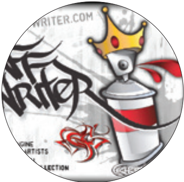
منابع: مجله دانشمند، همشهری، دیجیاتو

دارند. امروز می‌خواهیم یکی از این سایت‌ها را بهتان معرفی کنیم؛ graffitiwriter.com؛ این جا از ابزارهای گرافیکی تخصصی و سخت، خبری نیست. کافی است متن مد نظرتان، اسم، اسم مستعار یا هر چیز دیگری را توی گزینه sample تایپ کنید. در سمت چپ صفحه، زیر این باکس بخش‌های دیگری وجود دارد که باید آن‌ها را پر کنید؛ اندازه متن، رنگ متن، شیب و رنگ پس‌زمینه را انتخاب کنید. البته با توجه به طرح‌های زاخار موجود در سایت برای پس‌زمینه، پیشنهاد می‌کنیم بی‌خیال این گزینه شوید. از قسمت font، یک خط باحال پیدا کنید و با مجموعه این‌ها گرافیتی خاص خودتان را بسازید. ممکن است دفعات اول، کار خیلی شیک از آب در نیاید. از آن جایی که خدمات این سایت کاملاً رایگان است، بد به دل‌تان راه ندهید؛ ه‌ی بسازید و ه‌ی گزینه reset را بزنید تا به طرح دلخواه‌تان برسید. graffitiwriter نرم‌افزار هم دارد منتها فقط برای آی‌اواس.