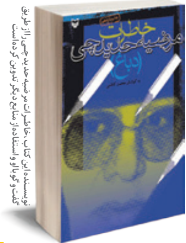
نویسنده این کتاب، خاطرات و ضمیمه‌های خود را از طریق گفت‌وگو و استقاده از منابع دیگر تدوین کرده است.

شد. بعد در سوریه و لبنان مشغول آموزش نظامی به مبارزان شد. در نوفل‌لوشاتو به امام‌پیوست. بعد انقلاب اولین فرمانده سپاه غرب کشور شد و چند سال بعد یکی از گروه‌سره‌نرهای بود که پیام تاریخی امام (ره) را به گور باجف ابلاغ کرد. سه دوره نماینده مجلس بود و حین مسئولیت‌های متعدّدش سرکشی از نیازمندان را فراموش نکرد. مدتی بعد از پایان دوره نمایندگی برای آن که بتواند کمک به خانواده‌های نیازمند را ادامه دهد، به مسافرکشی رو آورد تا این که در آبان ۱۳۹۵ در گذشت.