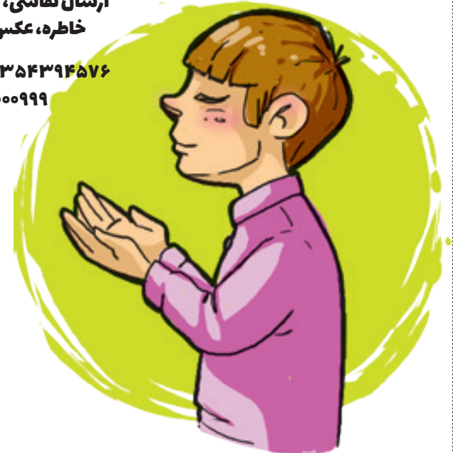
تصویرسازی ها: زهره افشاری