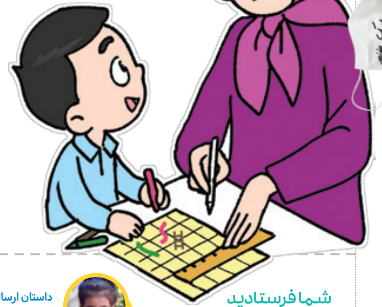
تصویر سازی ها : سعید مرادی