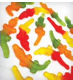
تصاویر شبیه شده از تمساح دریاچه چیتگر!