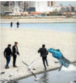
فوری یکی از شهروندان در حوالی دریاچه چیتگر توسط تمساح هدف حمله قرار گرفت!

● * مامانم چند سال بود می‌گفت ناهاری، شامی بریم دریاچه چیتگر بخوریم و تماشا کنیم، بابام همیشه مخالف بود. امروز بابام به مامانم گفت دیدی چه خوب شدن رفتیم اون‌جا خوراکی تمساح‌ها نشدیم!