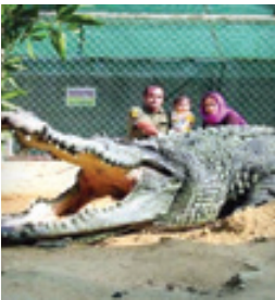
واکنش خانواده‌های ایرانی وقتی می‌فهمند دریاچه چیتگر تمساح‌داره!