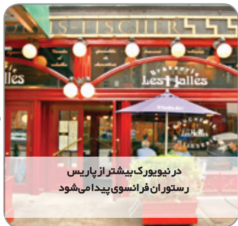
در نیویورک بیشتر از پاریس رستوران فرانسوی پیدا می‌شود

یعنی برایش چی خریده‌اند؟ لب‌تاپ؟ دوچرخه؟ توی مدرسه، زنگ آخر همه حواسش به تولدش بود. حتماً امسال جشن بزرگ‌تری برایش گرفته‌اند، هر چی نباشد ۱۵ سالش شده. آن قدر حواسش به این چیزها بود که اصلاً نفهمید کی و چطور به خانه رسید. کلید انداخت و در را باز کرد. چرا این قدر همه‌جا تاریک است؟ نکند همه رفته‌اند بیرون و او را فراموش کرده‌اند. نه، دوباره برق قطع شده است. بادیدن خانوادۀ‌هاش در آن وضعیت، انگار یک مسلط بیخ رویش خالی کرده باشند. پدرش جلوی تلویزیون لم داده بود، مادرش توی آشپزخانه مشغول بود و برادرش مثل همیشه غرق در گوشی. چندتا نفس عمیق کشید تا به خودش مسلط شود. چشم‌هایش را بست و محکم فشار داد. زیر لب به خودش گفت: «مهسا هر کی ندونه، فکر می‌کنه تو تولد ندیده‌ای. آروم باش دختر». یک سلام سرسری کرد و رفت توی اتاقش. با ناراحتی خودش را روی تخت انداخت. حتی حوصله لباس عوض کردن نداشت. چند ساعتی روی تخت ماند. مدام به خودش می‌گفت «تولد می‌ادشون رفته». بالاخره بلند شد، لباس‌های خانه‌اش را پوشید و سعی کرد توی آن تاریکی طوری سرش را گرم کند ولی از فکر تولد بیرون نمی‌آمد. موقع شام صدایش زدند. مهیار با نور گوشی اش سفره را روشن کرده بود اما کافی نبود. مادر گفت: «الان میرم شمع میارم». توی آشپزخانه نور زیادی دیده می‌شد که مال یک شمع نبود. مهسا حدس زد لابد مال چندتا شمع است، شاید ۱۵ شمع. در ست حدس زده بود، مادرش با یک کیک خوشگل و ۱۵ تا شمع رویش از آشپزخانه بیرون آمد. پدر داد زد: «مهیار فیوز رو وصل کن». مهسا فکر کرد این بهترین تولد عمرش است.