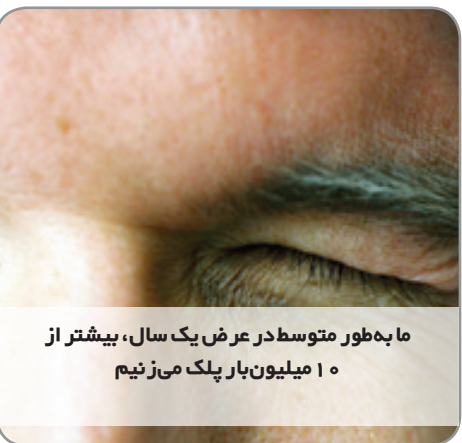
ما به طور متوسط در عرض یک سال، بیشتر از ۱۰ میلیون بار پلک می‌زنیم