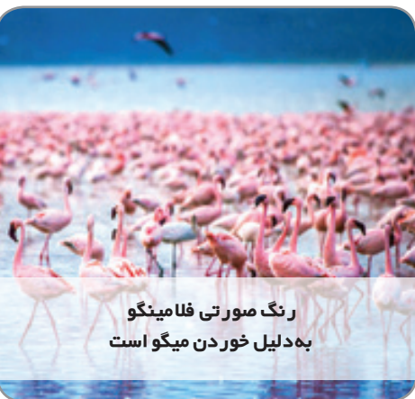
رنگ صورتی فلامینگو به دلیل خوردن میگو است