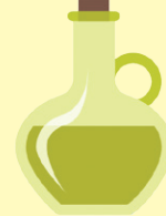
روغن زیتون و نارگیل