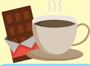
قهوه و شکلات تلخ