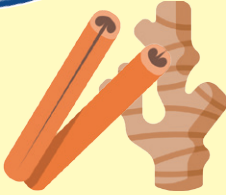
دارچین و زردچوبه