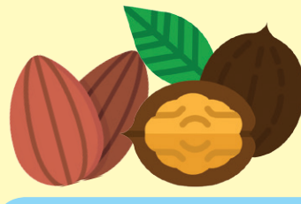
گردو، بادام و انواع توت‌ها