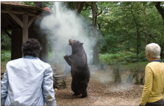
منابع این پرونده: nationalgeographic.com-nida.nih.gov-نوا مشاور-روزناتوو...

این‌که آیا حیوانات هم می‌توانند مانند انسان‌ها معتاد شوند سوال دانشمندان زیادی است. آن‌ها برای پیدا کردن جواب این سوال با تکیه بر شیوه‌های علمی در حال بررسی همه داده‌های احتمالی هستند، برای مثال در یک تحقیق تعدادی موش صحرایی با تزریق مورفین یا هروئین به‌طور منظم به مدت ۲۰ روز در معرض مواد مخدر قرار گرفتند. پس از آن، محققان اهرمی فراهم کردند که به موش‌ها اجازه می‌داد داروی خود را تزریق کنند؛ هنگامی که آن‌ها از نحوه کار با اهرم آگاه می‌شدند به‌طور منظم از اهرم برای تزریق استفاده می‌کردند. همچنین دانشمندان دریافتند که اسب‌ها به‌شدت به مواد مخدر علاقه‌مند می‌شوند و این گرایش، بیشتر به‌سبب آثار روانی است که استفاده از مواد بر آن‌ها دارد. بر همین اساس مشخص شد، اسب‌هایی که روی چمن‌های حاوی مواد مخدر قرار می‌گیرند، در مقایسه با اسب‌هایی که چنین شرایطی را تجربه نمی‌کنند، باز دست‌دادن چنین موقعیتی بسیار افسرده‌می‌شوند، کمبود مواد به‌عنوان یک اثر ناتوان‌کننده در مغز آن‌ها به شمار می‌رود و طول عمرشان به‌شکل قابل توجهی کاهش می‌یابد.