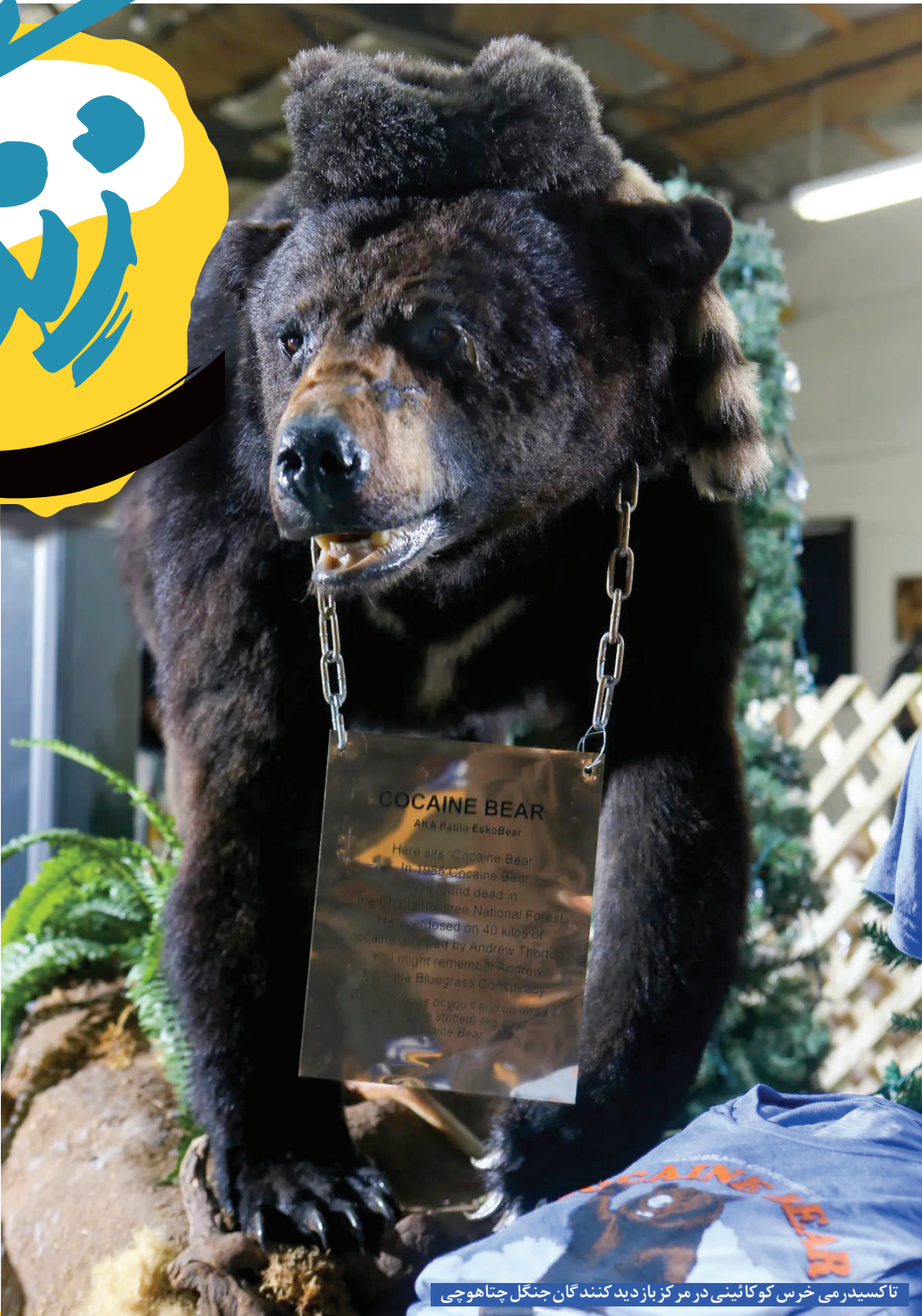
تاکسیدرمی خرس کو کائینی در مرکز بازدیدکنندگان جنگل چناهوچی