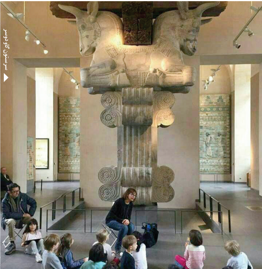
سرسون گاو دوسر