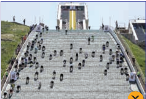
مسابقات دو و میدانی در سربالایی در قزاقستان، عکس از خبرگزاری فرانسه

تصادف شدید در مسابقات سرعت در آمریکا، عکس از getty images