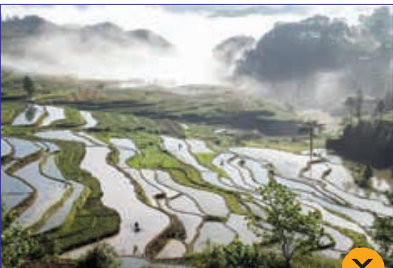
یک دریاچه طبیعی یله ای در جنوب غرب چین