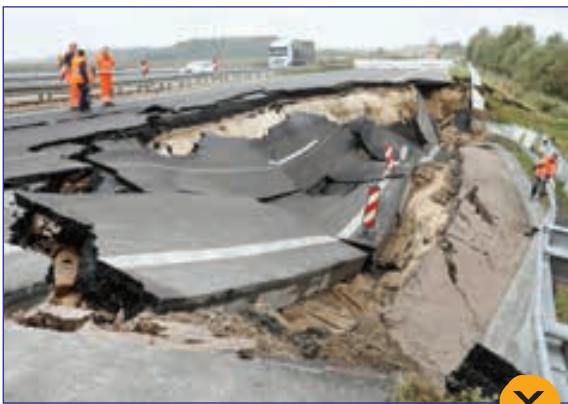
تلگراف- نشست بزرگراهی در آلمان

گاردین- دانشمندی روی قله کوه به انتظار عبور توفان نشسته تا آن را ثبت کند