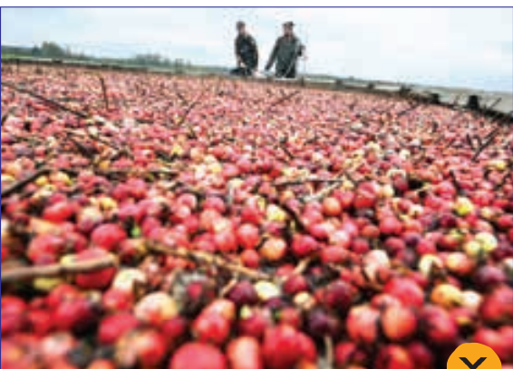
برداشت میوه از مزارع بلاروس