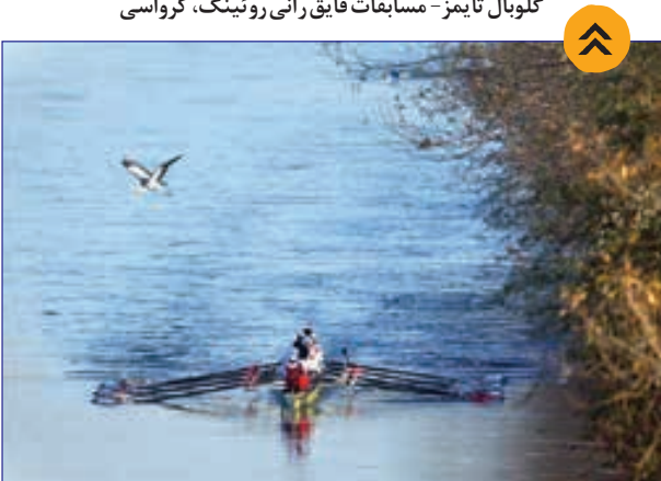
مسابقات قایق رانی روئینگ، کرواسی