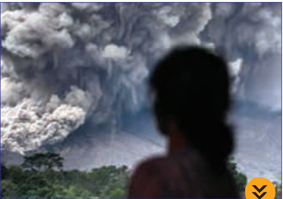
شینهو- دود و خاکستر آتشفشانی در سوماترا، اندونزی