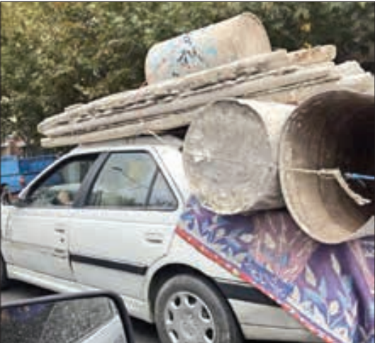
وقتی اعتقادی به استفاده از وات نداری!