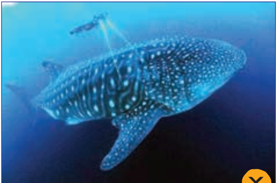
تلگراف- اندازه گیری بزرگ ترین موجود اقیانوس با لیزر، کوسه هینگ ۱۲ متری و ۲۰ تنی