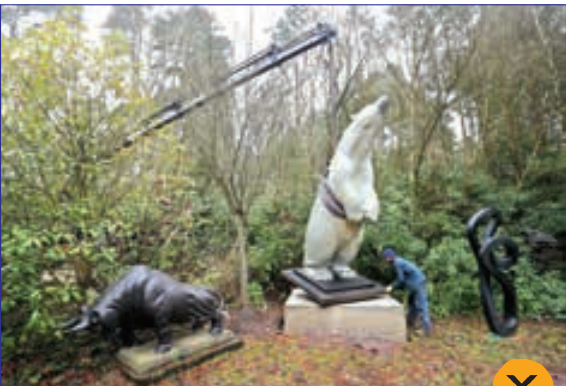
نصب مجسمه برنزی ۷۰۰ کیلویی خرس قطبی در یک پارک، انگلستان