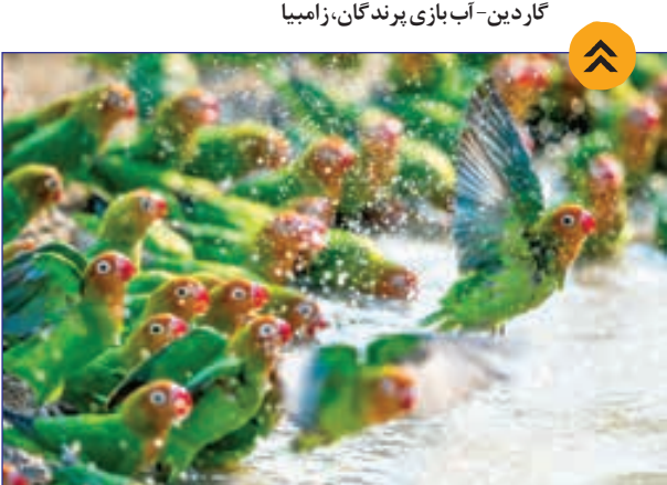
آب بازی پرندگان، زامبیا