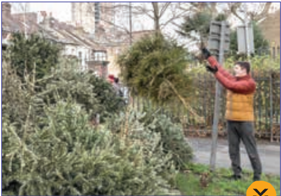
تلگراف- جمع آوری و باز یافت درخت های کریمس، انگلستان