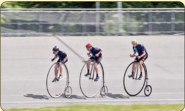
مسابقات دوچرخه سواری سبک قدیم، انگلستان