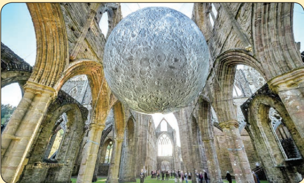
پی‌ای | بخشی از موزه ماه، ولز

تا تو هستی و غزل هست دل‌تانه نیست محرمی چون تو هنوزم به چنین دنیا نیست از تو تا ما سخن عشق همان است که رفت که در این وصف، زبان دگری گویا نیست بعد تو قول و غزل هاست جهان را اما غزل توست که در قوئی از آن ما نیست