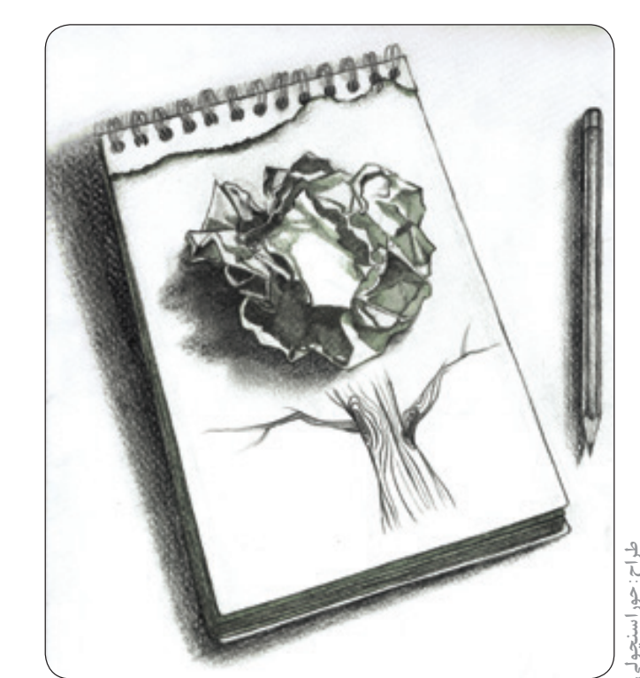
طرح خوار استواری