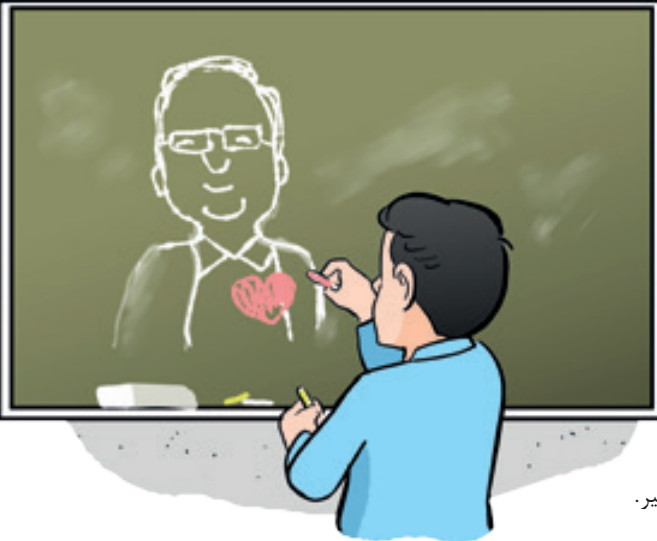
نوجوان‌های عزیز، سلام!

حال تون چطوره؟ غیر از درس و مدرسه، روزها تون رو چطور می‌گذرونین؟ تازگی فیلم خوبی دیدین که دوست داشته‌باشین به بقیه هم معرفیش کنین؟ کتاب جدید، چی؟ موسیقی بترکون تازه چی گوش دادین؟ اهل گالری و نمایشگاه رفتن هستین؟ بهمون بگید یا چیزهایی سرتون و گرمی‌کنید و از چه کارهایی لذت می‌برین؟ اگه دوست داشته‌باشین حتی می‌تونین تجربه‌های لذت‌بخش تون رو از طریق «جوانه» با دوست‌ها تون به اشتراک بذارین. این‌ها هم راه‌هایی که می‌تونید با ما در تماس باشید: