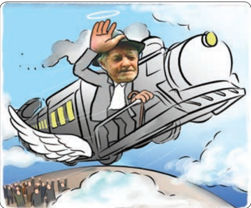
تصویرسازی: سعید مرادی